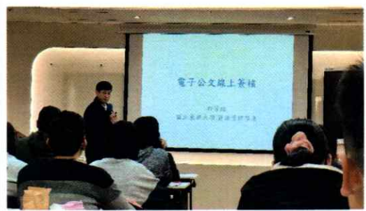
現代檔案管理講習班第51期課程