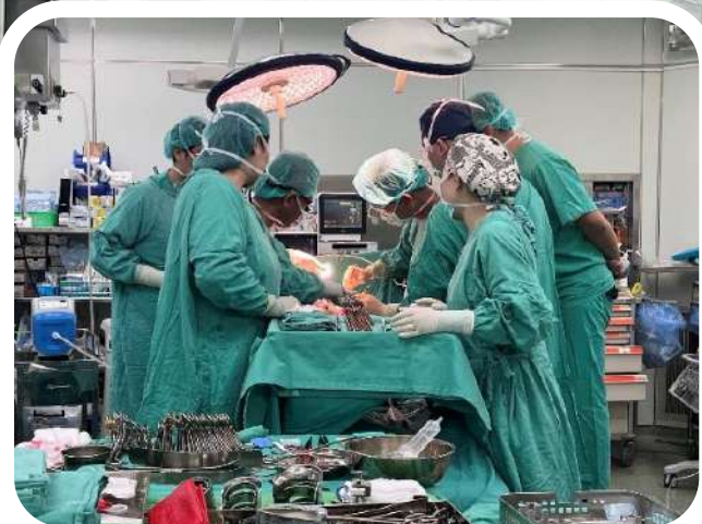
▲ 國軍高雄總醫院完成首例活體肝臟移植手術，同時也是國軍醫療體系第一家具移植資格的區域醫院。

本院第一例活體肝臟移植手術的成功，未來將可為更多類似情況的患者開啟了一扇門，對南部地區軍民帶來了也提供了更多的選擇和希望。