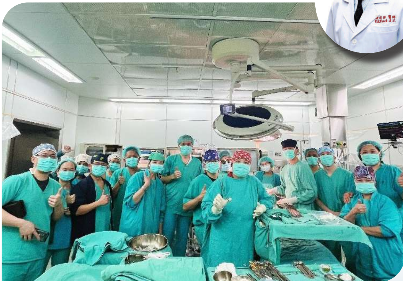
▲ 國軍高雄總醫院的肝臟移植團隊偕同三軍總醫院醫療團隊共同完成本院首例活體肝臟移植手術。